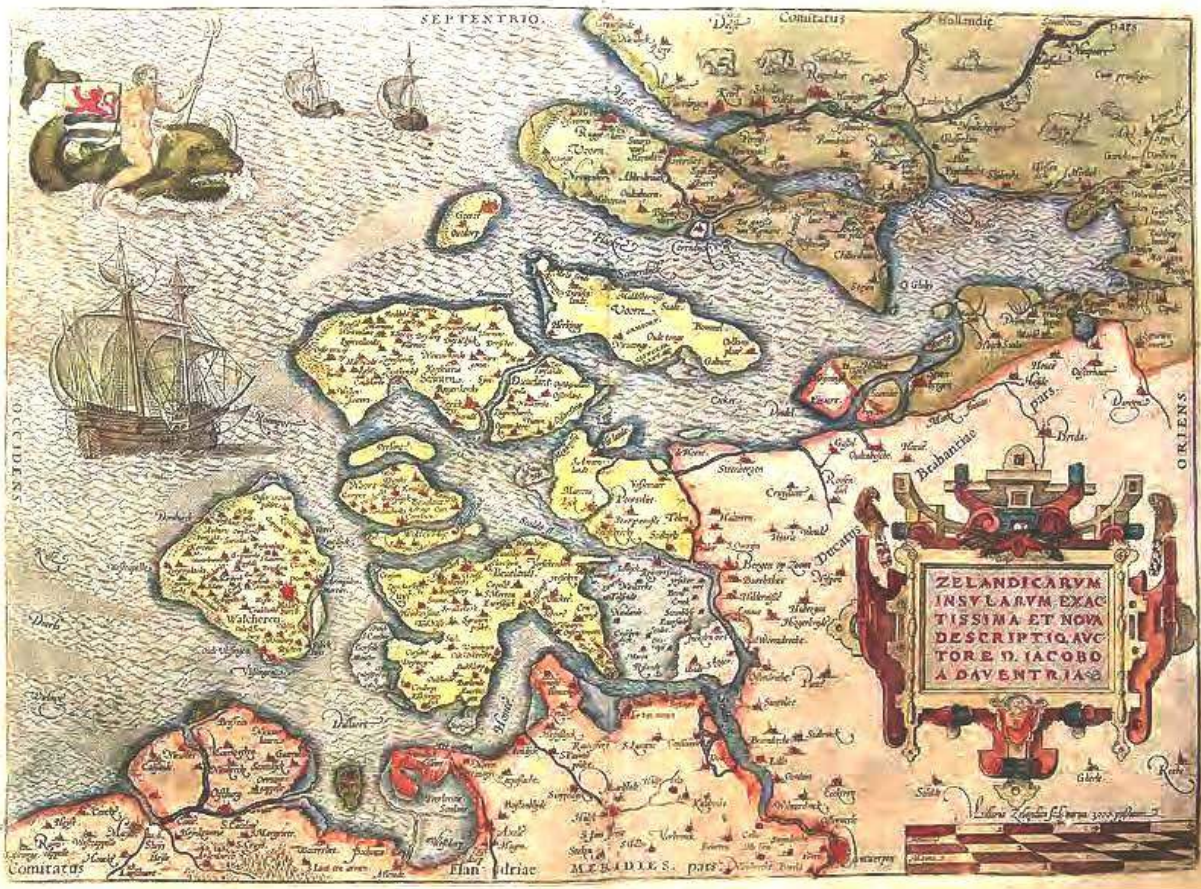
Historische kaart Zeeland begin 16e eeuw.

de sterk gehavende kustlijn en schuurden de gaten zo ver uit, dat Nederland aan het zeegatgeweld ten onder dreigde te gaan. Na de Zuiderzeevloed van 1916 werd eindelijk besloten om het grootste zeegat te sluiten. In het zuidwesten nam men na de ramp van '53 pas maatregelen.