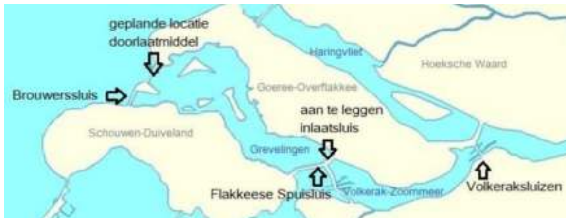
Locaties van bestaande en geplande sluisen

Waarom reikt het zeewater tot de Grevelingendam en grenst het niet aan de Brouwersdam? Zo'n vijftig jaar geleden is er gedegen studie verricht naar de meest effectieve, milieuvriendelijke en duurzame wijze van verzoeting van het Grevelingenmeer. Er werd vervolgens gestart met de voorbereidingen. De locatie en grootte van de Brouwerssluis en de hoogteligging van de sluisvloer op -11 m NAP zijn daarop gebaseerd. De spuisluisen in het Volkerak zijn aangelegd om Krammer-Volkerak, Grevelingen en Oosterschelde te verzoeten .